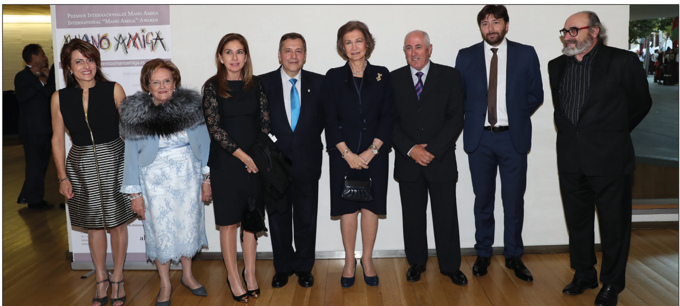
S.M. la Reina Doña Sofía, a su llegada al Auditorio, con representantes de Alzheimer León y miembros del jurado de los Premios Mano Amiga