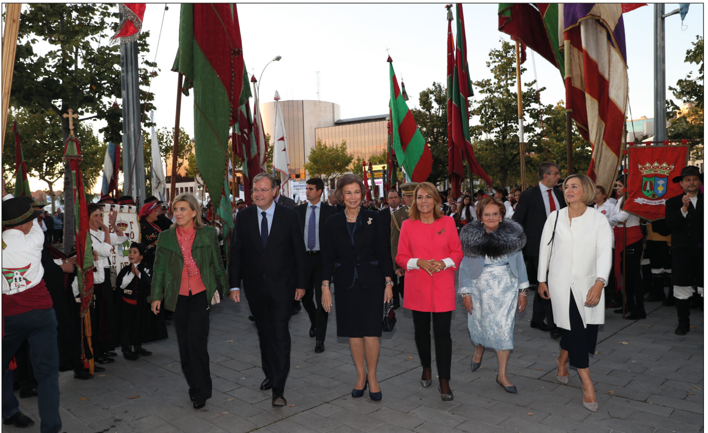
Las gaitas de Agávida y miembros de la Asociación Pendones Reino de León formaron un tradicional y colorido pasillo para recibir a los invitados.