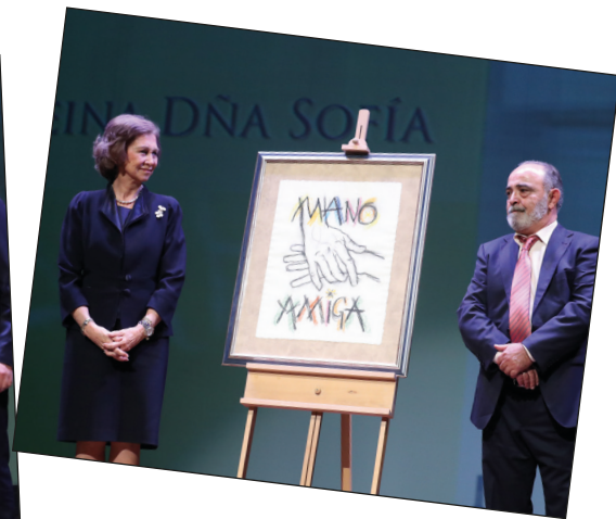
Reportaje gráfico Premios Mano Amiga: Casa de S.M. el Rey, Foto Luque y Focus.